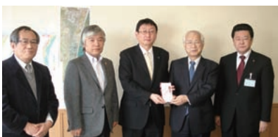
岩沼市長へ義援金贈呈