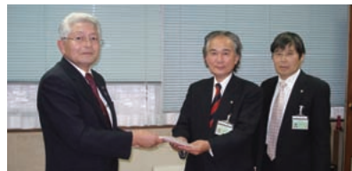
名取市長へ義援金贈呈