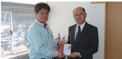
山元町長へ義援金贈呈

当法人会では、東日本大震災義援金 を募りましたところ、たくさんの皆様 から暖かいご支援をいただきました。 各支部役員より名取市長・岩沼市長・ 亘理町長・山元町長へ地域の明日を担 う小中学生の教育費用にあてて頂く 為、義援金の贈呈を行いました。