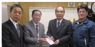
亘理町長へ義援金贈呈